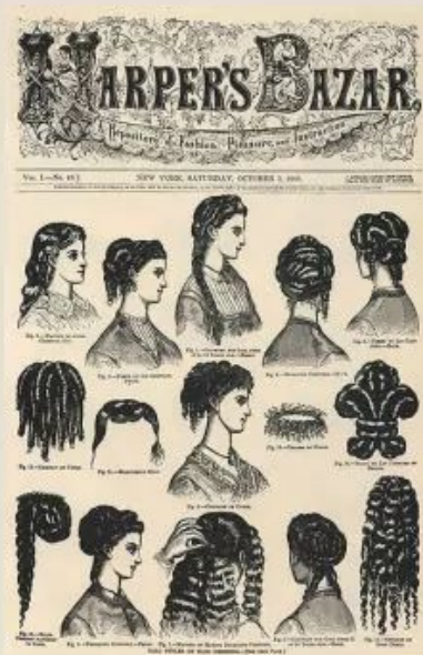
Harper's Bazaar od 1867