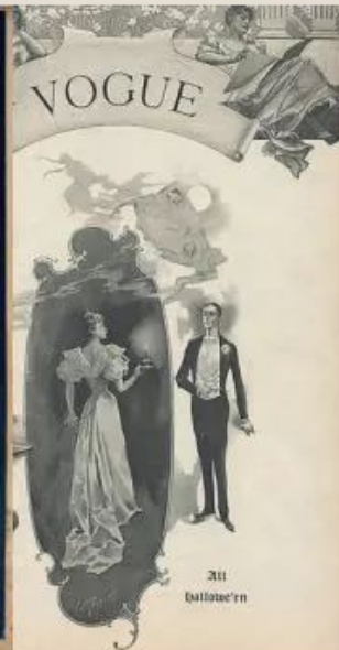
Vogue od 1892